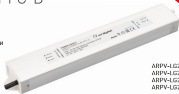
ARPV-LG24060-SLIM-PFC-D ARPV-LG24080-SLIM-PFC-D ARPV-LG24045-SLIM-PFC-D ARPV-LG24100-SLIM-PFC-D